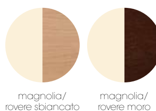
magnolia/rovere sbiancato magnolia/rovere moro

Обозреваемые боковые панели: магнолия/светлый дуб, магнолия/темный дуб.