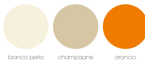
bianco perla champagne arancio

Finiture laccate lucide Polished lacquered finishes Finitions laquées polies Acabados lacados barnizados Полированное покрытие