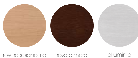
rovere sbiancato rovere moro alluminio

Цвет плинтуса: светлый дуб, темный дуб и алюминий.