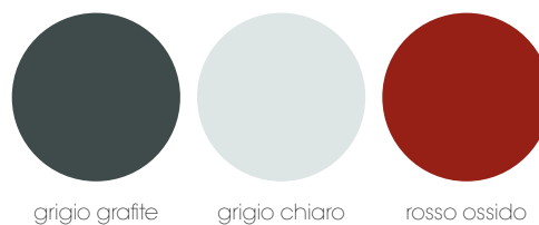
grigio grafite grigio chiaro rosso ossido

Finiture laccate metallizzate Metallized lacquered finishes Finitions laquées métallisées Acabados metalizados Металлическая отделка