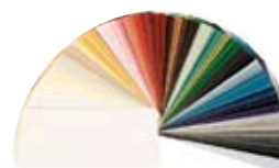
laminati cartella colori

Створки из прокатного материала предлагаются в различных отделках, с широким выбором цветовой гаммы.